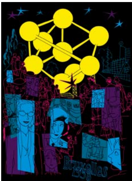
Dupuy&Berberian : Bruxelles 1958

A u départ influencé par la « Nouvelle Ligne Claire Française », Dupuy&Berberian ont depuis longtemps créé un style graphique unique. Amoureux de Bruxelles et des pépites de l'Age d'or de la BD belge, les derniers Grand Prix du Festival d'Angoulême se devaient de porter leur regard moderne sur l'Atomium.